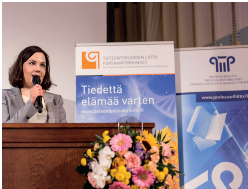
Opetusministeri Sanni Grahn-Laasonen piti puheenvuoron Kevätseminaarissa.

Edustajamme osallistui EI:n (Educational International) ja HERSC:in (Higher Education and Research Standing Committee) kokouksiin.