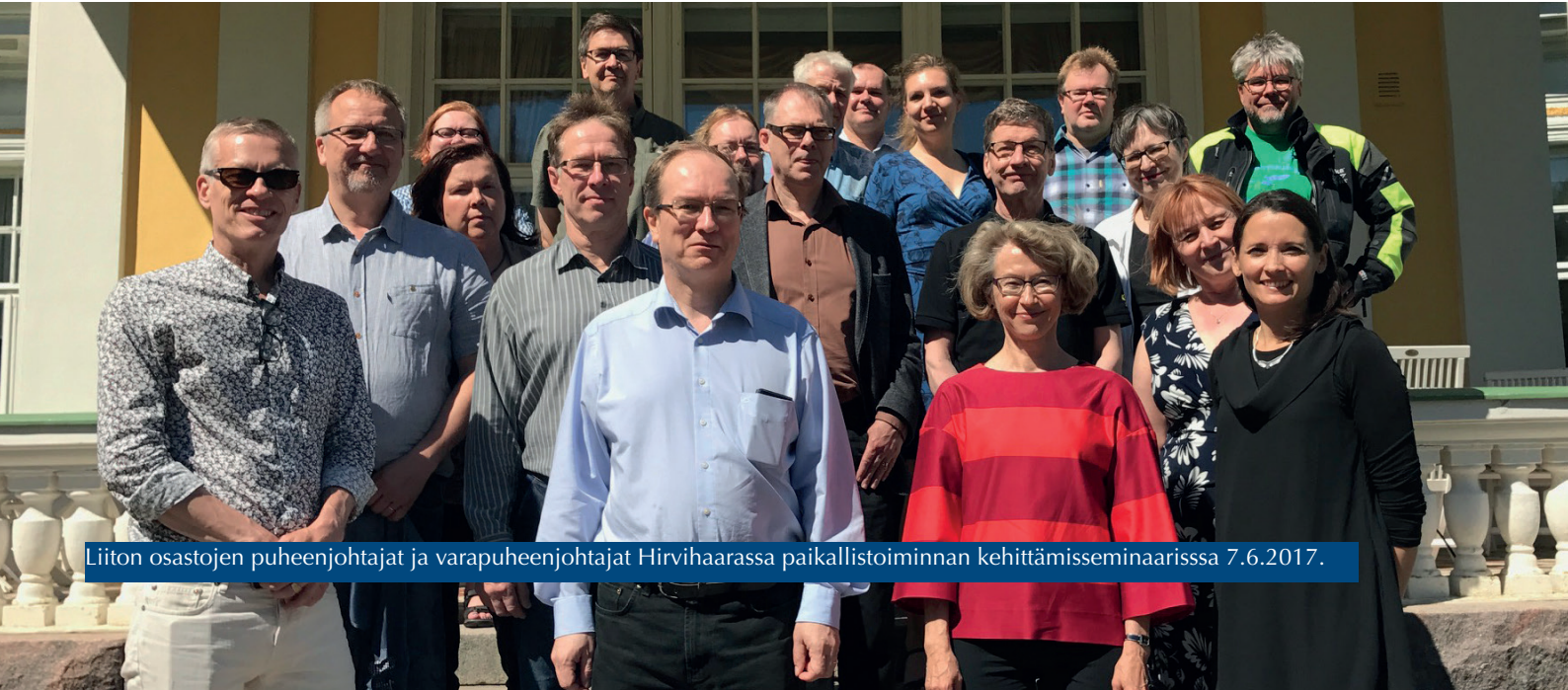
Liiton osastojen puheenjohtajat ja varapuheenjohtajat Hirvihaarassa paikallistoiminnan kehittämisseminaarissa 7.6.2017.

Tuimme liiton osastojen toimintaa taloudellisesti. Kannustimme osastoja huomioimaan Suomen itsenäisyyden juhlavuosi toiminnassaan. Osastojen kokouksiin osallistui vuoden mittaan 590 henkilöä. Liiton puheenjohtaja, toiminnanjohtaja ja järjestöpäällikkö vierailivat osastojen kokouksissa. Järjestimme osastojen luottamushenkilöille ja professori-luottamusmiehille paikallistoiminnan kehittämisseminaarin, jossa käsiteltiin muun muassa osastojen järjestämiä tapaamisia kansanedustajien kanssa, professori-nimikkeitä, tekijänoikeuksia ja liiton paikallistoiminnan vahvistamista. Osastojen puheenjohtajat ja varapuheenjohtajat kokoontuivat neuvottelupäiville, jossa käsiteltiin muun muassa yliopistojen johtamista.