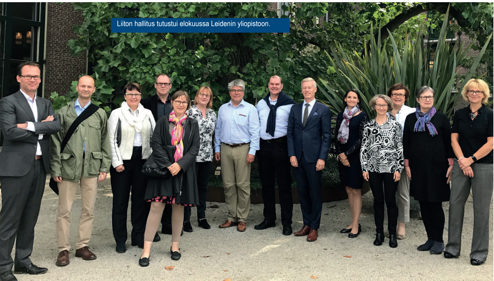
Liiton hallitus tutustui elokuussa Leidenin yliopistoon.

Olimme eduskunnan valtiovarainvaliokunnan sivistys- ja tiedejaoston kultavana valtion talousarvioesityksestä vuodelle 2018. Toimitimme sivistysvaliokunnalle kirjallisen lausunnon valtion talousarvioesityksestä vuodelle 2018.