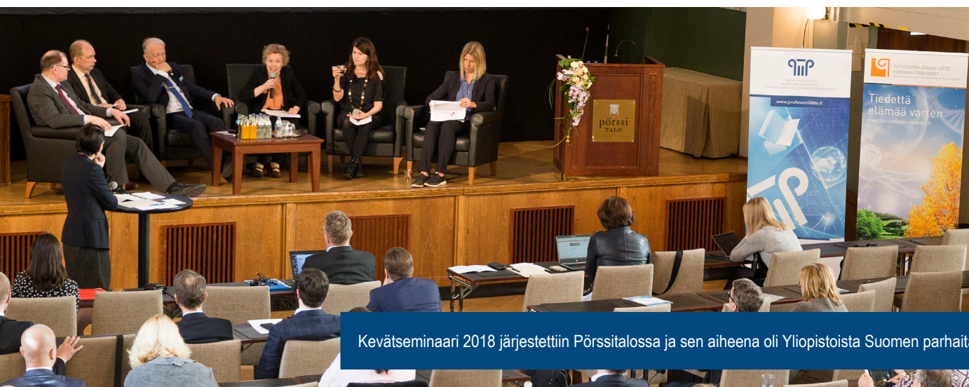
Kevätseminaari 2018 järjestettiin Pörssitalossa ja sen aiheena oli Yliopistoista Suomen parhaita työpaikkoja.

Olimme sivistysvaliokunnan kuultavana sekä osallistuimme opetus- ja kulttuuriministeriön asettamien työryhmien työskentelyyn sekä muuhun toimintaan. Antamamme lausunnot perustuivat