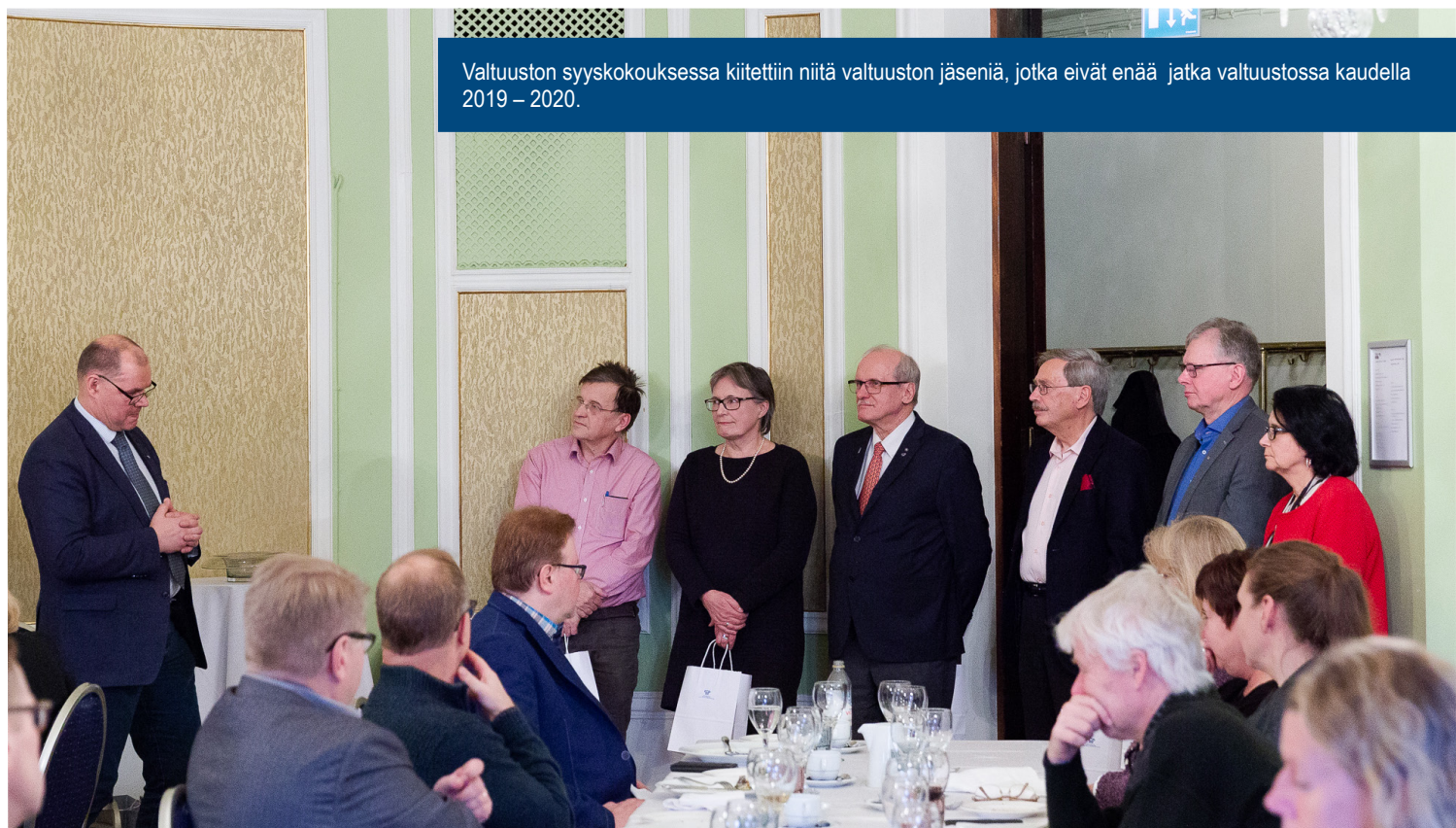
Valtuuston syyskokouksessa kiitettiin niitä valtuuston jäseniä, jotka eivät enää jatka valtuustossa kaudella 2019 – 2020.