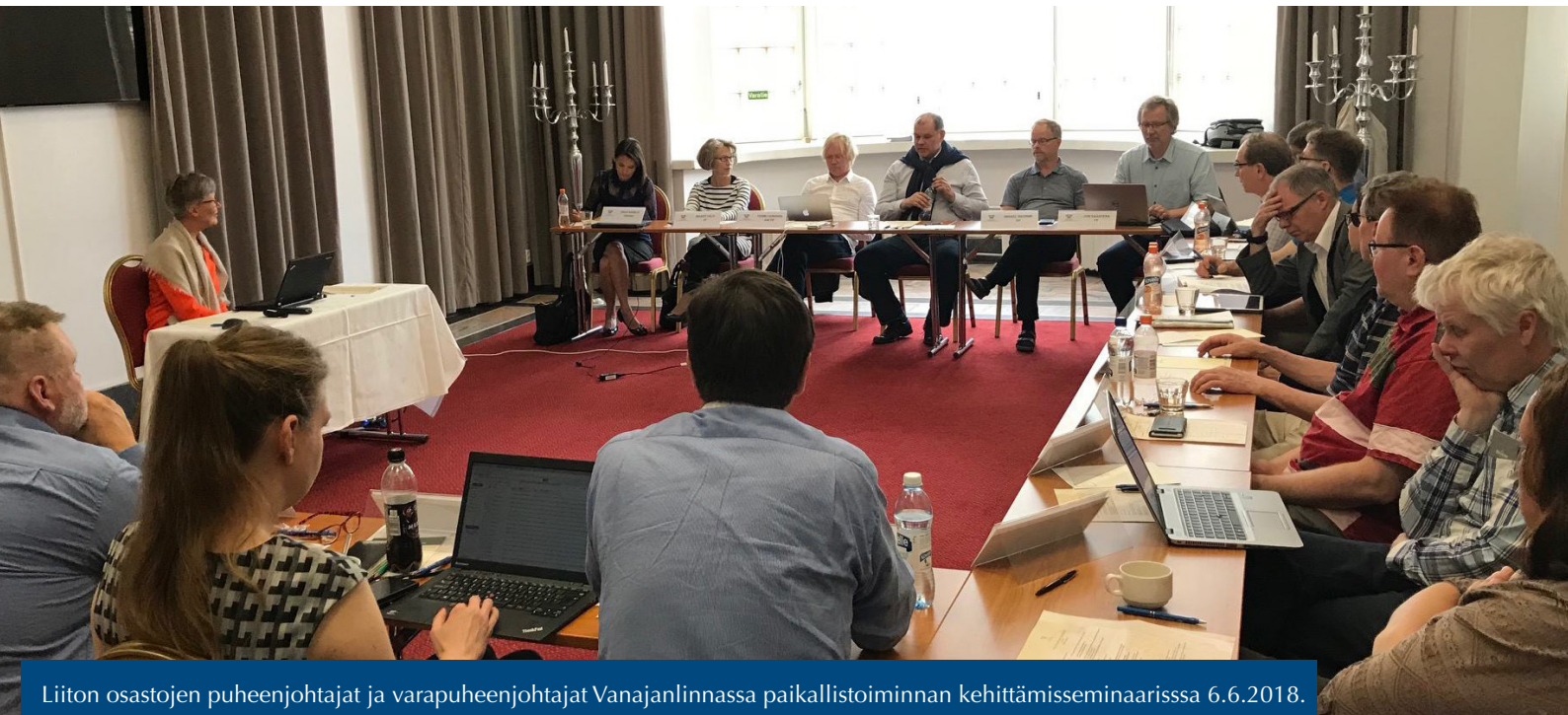
Liiton osastojen puheenjohtajat ja varapuheenjohtajat Vanajanlinnassa paikallistoiminnan kehittämisseminaarissa 6.6.2018.

Teimme selvityksen johtotehtävissä olevien jäsentemme edunvalvonnan tarpeista. Säilytimme jäsenedut ennallaan, kuten esimerkiksi vapaa-ajan matka- ja tapaturmavakuutuksen. Loppuvuodesta 2018 teimme päätöksen siirtää jäsenten vapaa-ajan tapaturmavakuutuksen ja matkavakuutuksen Vakuutusyhtiö Fenniaan 1.1.2019 alkaen. Samalla vakuutuksien yläkärärajaa päätettiin nostaa 75 vuodesta 80 vuoteen.