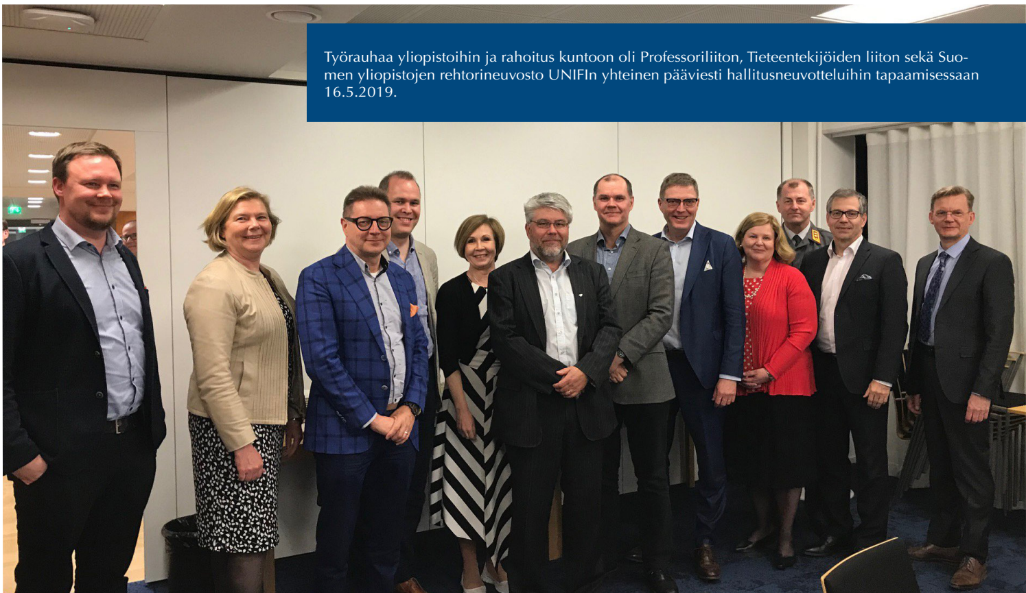
Työrauhaa yliopistoihin ja rahoitus kuntoon oli Professoriliiton, Tieteentekijöiden liiton sekä Suomen yliopistojen rehtorineuvosto UNIFIn yhteinen pääviesti hallitusneuvotteluihin tapaamisessaan 16.5.2019.