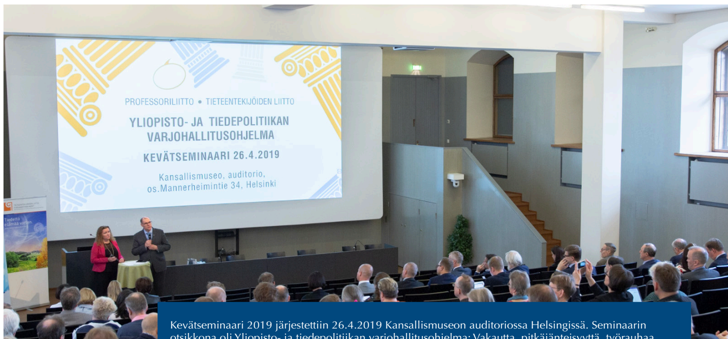
Kevätseminaaari 2019 järjestettiin 26.4.2019 Kansallismuseon auditoriossa Helsingissä. Seminaarin otsikkona oli Yliopisto- ja tiedepolitiikan varjohallitusohjelma: Vakautta, pitkäjänteisyyttä, työrauhaa.

Kannustimme osastojamme ottamaan yhteyttä oman alueensa kansanedustajiin ja muihin yhteiskunnallisiin päättäjiin. Useat osastot kutsuivat alueensa kansanedustajia syys- ja kevätkokouksiin.