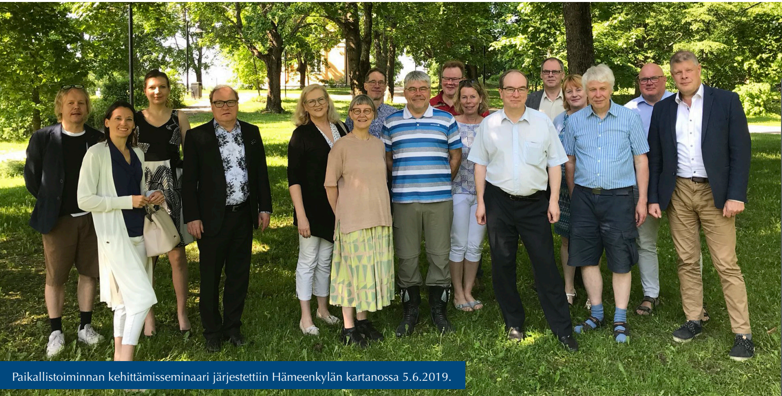
Paikallistoiminnan kehittämisseminaari järjestettiin Hämeenkyllän kartanossa 5.6.2019.

Säilytimme jäsenedut ennallaan, kuten esimerkiksi vapaa-ajan matka- ja tapaturmavakuutuksen. Siirsimme jäsenten vapaa-ajan tapaturmavakuutuksen ja matkavakuutuksen Vakuutusyhtiö Fenniaan 1.1.2019 alkaen. Samalla vapaa-ajan tapaturmavakuutuksen yläikäraja nostettiin 75 vuodesta 80 vuoteen ja vapaa-ajan matkavakuutuksen yläikäraja poistettiin.