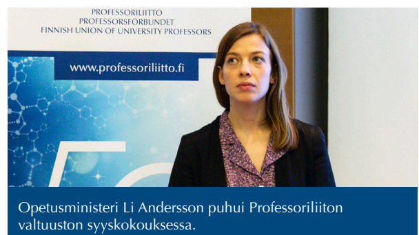
Opetusministeri Li Andersson puhui Professoriliiton valtuuston syyskokouksessa.

Annoimme jäsenillemme eläkeasioita koskevaa neuvontaa.