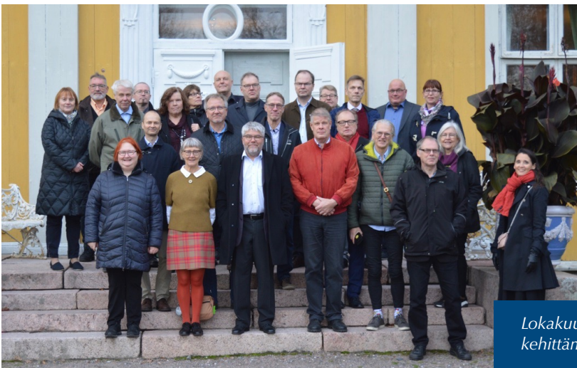
Lokakuussa järjestimme paikallistoiminnan kehittämisseminaarin Mustion linnassa.

liitto oli lähettänyt kutsun, mutta jotka eivät olleet liittyneet liittoon.