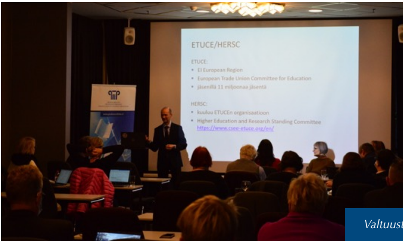
Valtuuston syyskokous järjestettiin lähikokouksena.