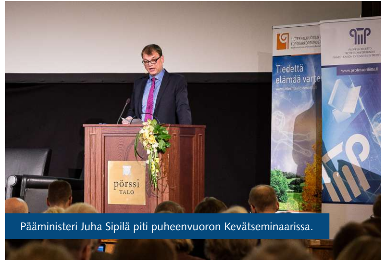
Pääministeri Juha Sipilä piti puheenvuoron Kevätseminaarissa.

Julkaisimme Acatiimi-lehteä yhdessä Tieteentekijöiden liiton ja Yliopistojen opetusalan liitto YLL:n kanssa. Acatiimin painosmäärä oli 12 200 kappaletta ja lehteä ilmestyi yhdeksän numeroa. Lehden verkkosivuston visuaalista ilmettä ja toiminnallisuutta uudistettiin syyskauden alussa. Acatiimilla on myös Facebook-sivu.