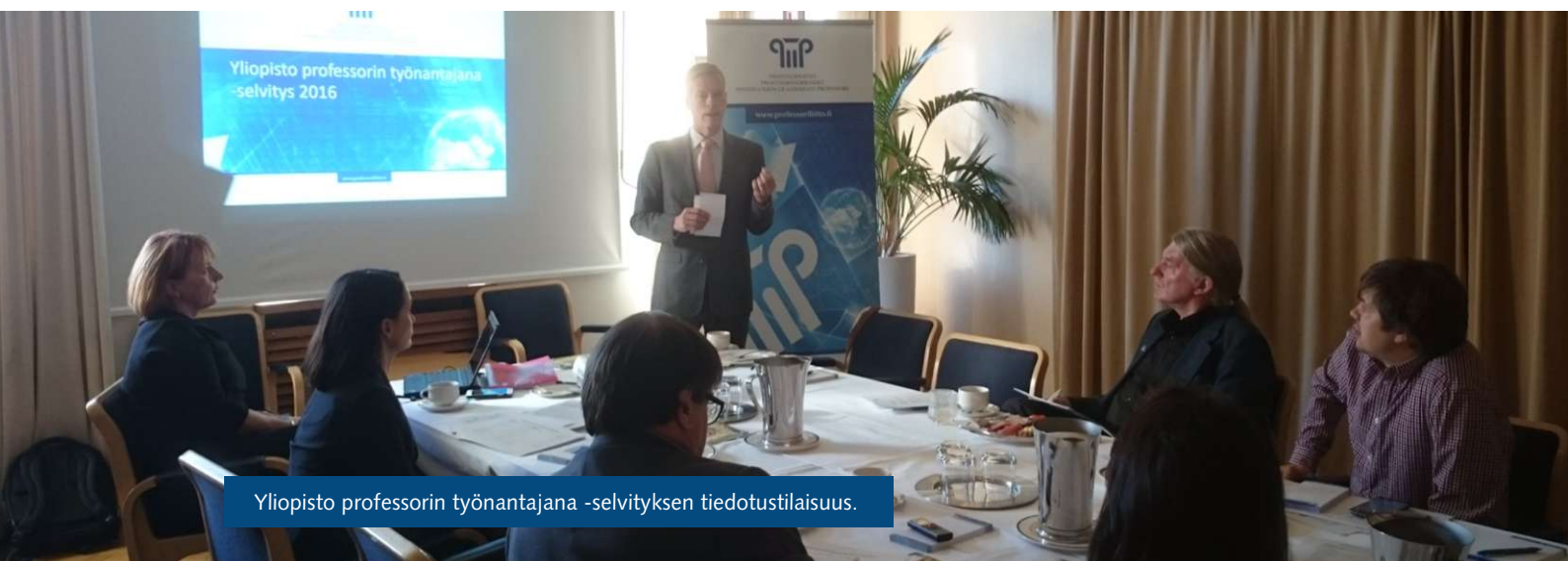
Yliopisto professorin työnantajana -selvityksen tiedotustilaisuus.

Professorit voivat keskittyä varsinaisiin tehtäviinsä, ja heidän työskentelyolosuhteensa mahdollistavat hyvän työn