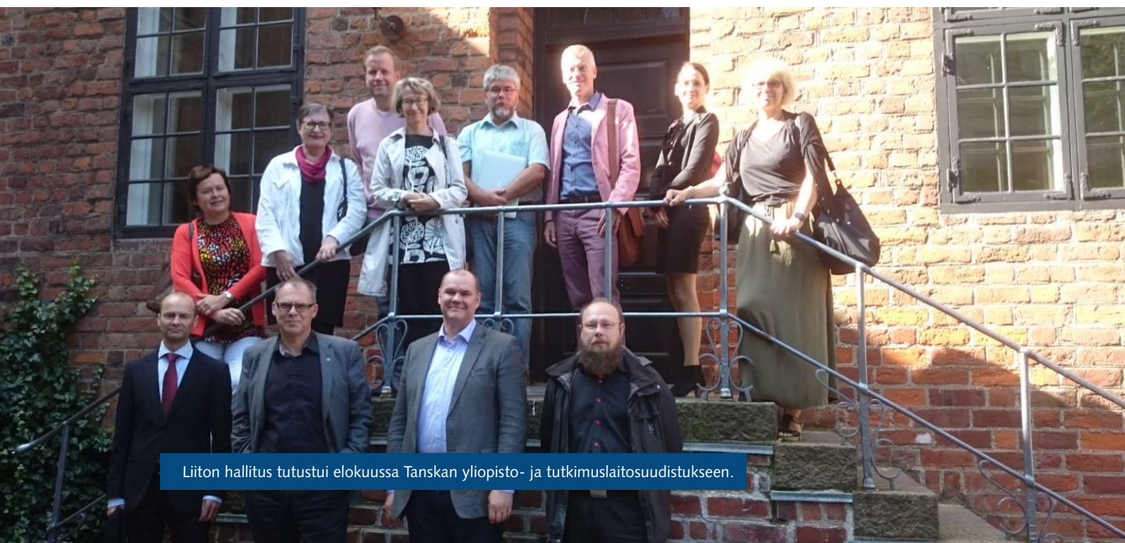
Liiton hallitus tutustui elokuussa Tanskan yliopisto- ja tutkimuslaitosuudistukseen.

Osallistuimme valtiovarainministerin ja opetus- ja kulttuuriministerin kutsusta tilaisuuteen, jossa pohdittiin sivistyksen, tutkimuksen ja yliopistomaailman suuntaa. Ylläpidimme hyvää vuoropuhelua erityisesti opetus- ja kulttuuriministerin kanssa. Opetus- ja kulttuuriministerin, liiton puheenjohtajan ja kahden muun professorin yhteinen mielipidekirjoitus tutkimukseen panostamisen tärkeydestä julkaistiin Helsingin Sanomissa maaliskuussa.