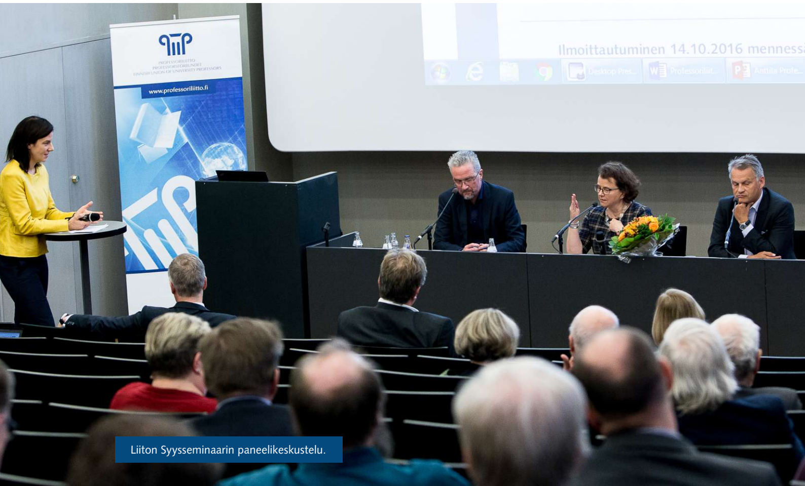
Liiton Syysseminaarin paneelikeskustelu.

Vaikutimme siihen, että professoreiden suhteellista osuutta opetus- ja tutkimushenkilöstöstä lisätäisiin, ja että tenure track -järjestelmä (professorin vakinaistamispolku) ei johtaisi professuurien vähenemiseen. Otimme edellä mainittuja asioita esiin esimerkiksi yliopistojen johdon tapaamisissa.