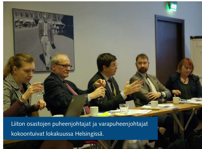
Liiton osastojen puheenjohtajat ja varapuheenjohtajat kokoontuivat lokakuussa Helsingissä.

Tuimme liiton osastojen toimintaa taloudellisesti. Osastojen kokouksiin osallistui vuoden mittaan satoja liiton jäseniä. Liiton puheenjohtaja, toiminnanjohtaja ja järjestöpäällikkö vierailivat osastojen kokouksissa. Järjestimme osastojen luottamushenkilöille ja professori-luottamusmiehille paikallistoiminnan kehittämisseminaarin, jossa käsiteltiin muun muassa