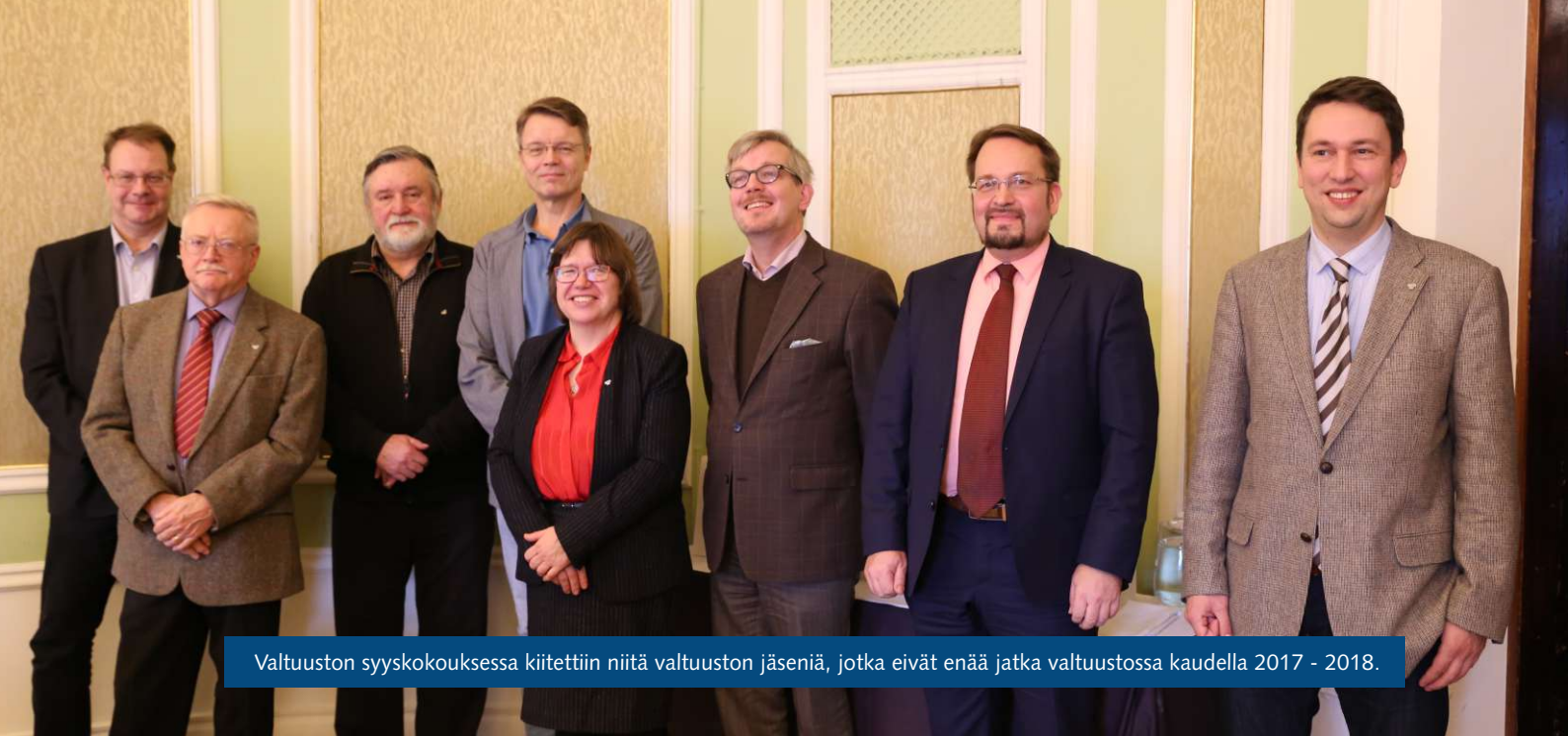
Valtuuston syyskokouksessa kiitettiin niitä valtuuston jäseniä, jotka eivät enää jatka valtuustossa kaudella 2017 - 2018.