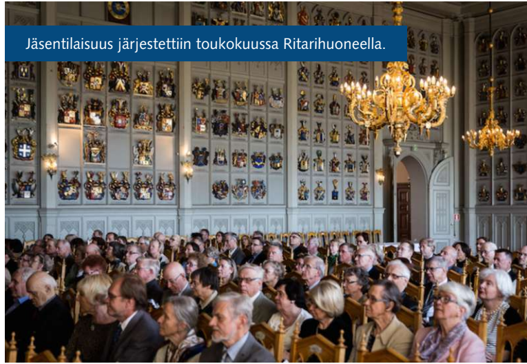
Jäsentilaisuus järjestettiin toukokuussa Ritarihuoneella.

Järjestimme jäsentilaisuuden Ritarihuoneella. Tilaisuudessa käsiteltiin luokkayhteiskuntaa ja professoreita poliittisina vaikuttajina. Avec-tilaisuus kokosi yhteen noin 160 osallistujaa.