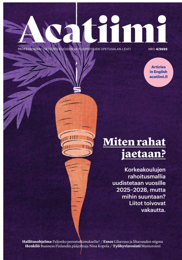
Acatiimi-lehden kannet 1/2023 ja 4/2023.